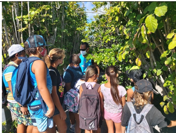
Ancien marae RA'AIVA de TAU'ARAUFAFA . Il ne reste qu'une seule pierre de ce lieu de cérémonie