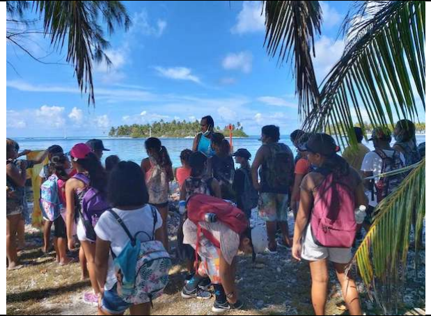
La pointe PEREHAHU avec en arrière plan le quai de AVATORU. Nous sommes dans l'enceinte de l'église catholique où était fondé autrefois un grand marae « RA'IHORO » .