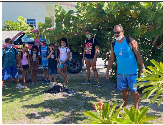
Une ancienne citerne populaire MANUHITIRERE à TAU'ARAUFAFA où la population d'autrefois venait se ravitailler en eau.