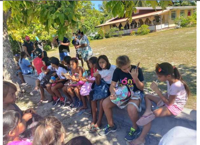
Des pauses s'imposent !