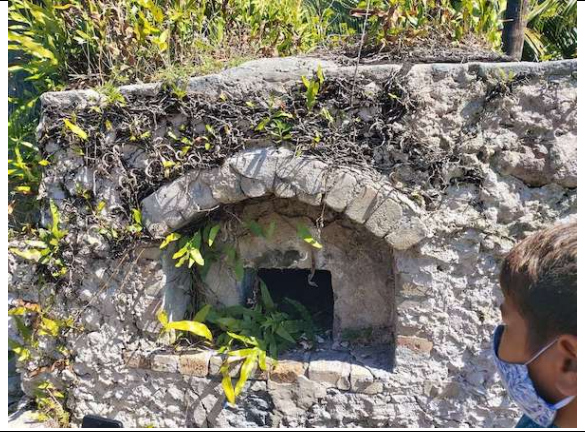
Les anciens fours populaires du village de Avatoru. Autrefois , on y cuisait du pain et bien d'autres mets ...