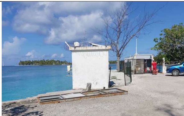
La Marina de Avatoru a été construite sur un immense remblai . Ce local contient un appareil de mesure des marées et des houles.