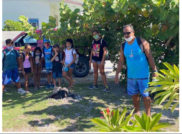
Une ancienne citerne populaire MANUHITIRERE à TAU'ARAUFAFA où la population d'autrefois venait se ravitailler en eau.

Te tura komo huiragatira tāhito MANUHITIRERE i TAU'ARAUFAFA.