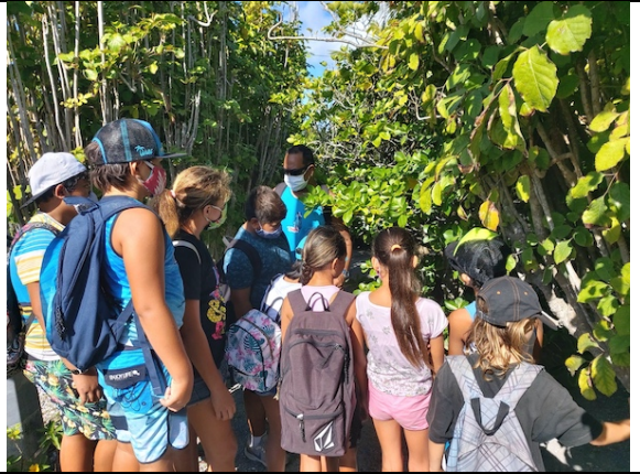
Ancien marae RA'AIVA de TAU'ARAUFAFA . Il ne reste qu'une seule pierre de ce lieu de cérémonie Te marae RA'AIVA. E rari anake konao e toe ra.