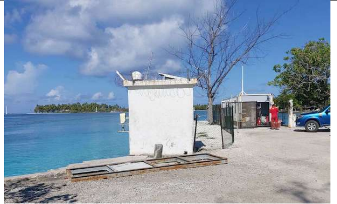
La Marina de Avatoru a été construit sur un immense remblai . Te ūahu nō AVATORU

Ce local contient un appareil de mesure des marées et des houles.